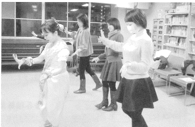
実際に身体を動かしながらカンボジア舞踊を学習