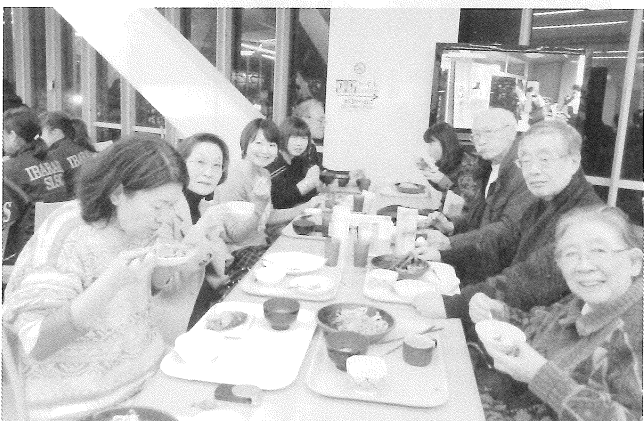
合宿では食事と共に親睦を深めた