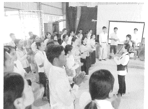
音楽研修会で成果を発表する教員