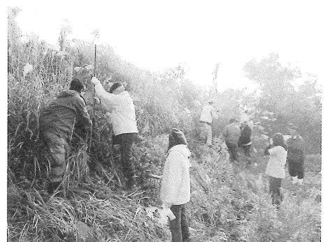
復興支援の桜植樹はもうすぐ1000本に