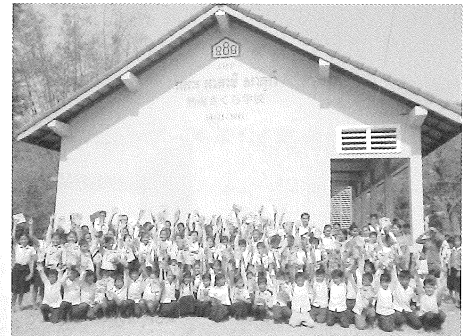
建設後も定期的に文具支援を受ける子ども達