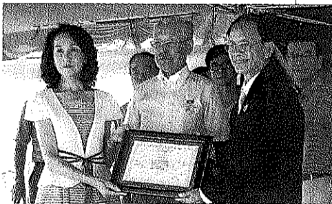
トウ・サロウ教育省次官(右)が感謝状を授与