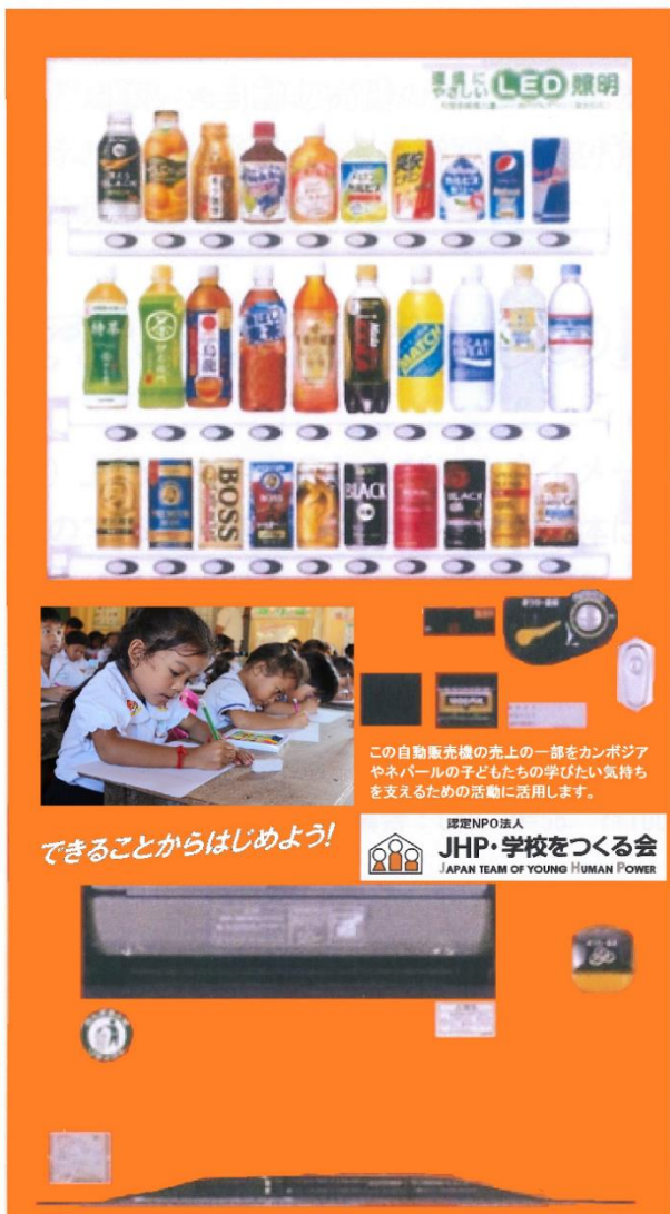
<JHP・募金型自販機イメージ>

※設置場所等の諸条件によって設置できないケースもございます。まずはお気軽にご相談ください！