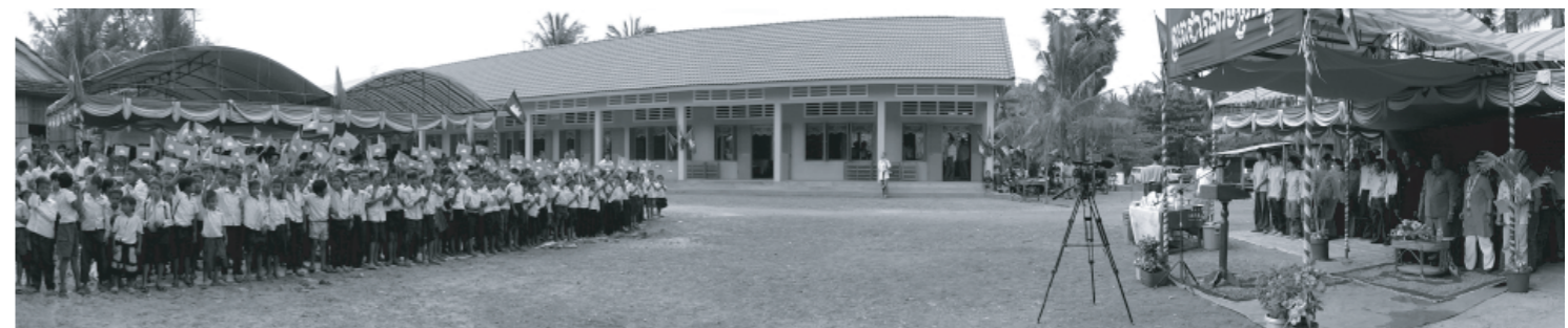
オーブラムティーピー小学校贈呈式の様子